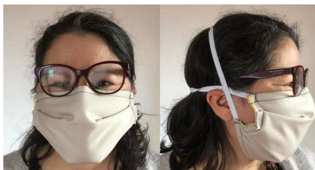
Exemple de masque à plis

La Mairie assurera le transport de ce kit jusqu'aux domiciles des couturières ou couturiers, et le remettra avec les précautions sanitaires d'usage.