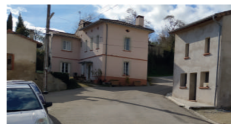
haut de la rue du moulin qui sera aménagée

Il n'y aura pas de dispositifs de type plateaux ralentisseurs dans la rue du Moulin.