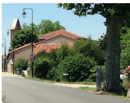
Entrée sud qui sera aménagée

Nous souhaitons présenter ce projet aux habitants de Lissac, en présence du cabinet 2AU.