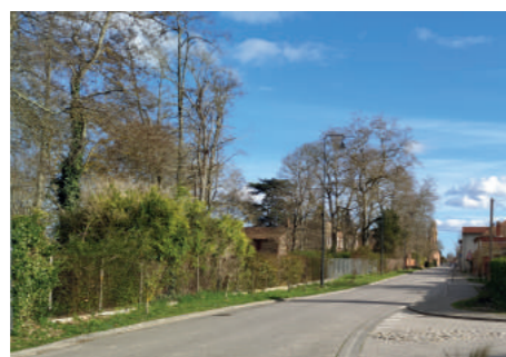
Entrée sud qui sera aménagée

Nous vous proposons une réunion publique à ce sujet le 15 mars 2022, à 20h30, à la salle des fêtes.